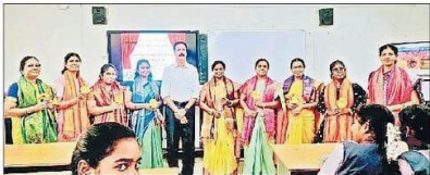
మహిళా ఉద్యోగులను సన్మానిస్తున్న ప్రిన్సిపాల్ తదితరులు