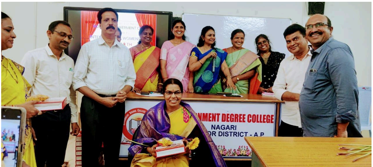
Felicitation to the lady staff members