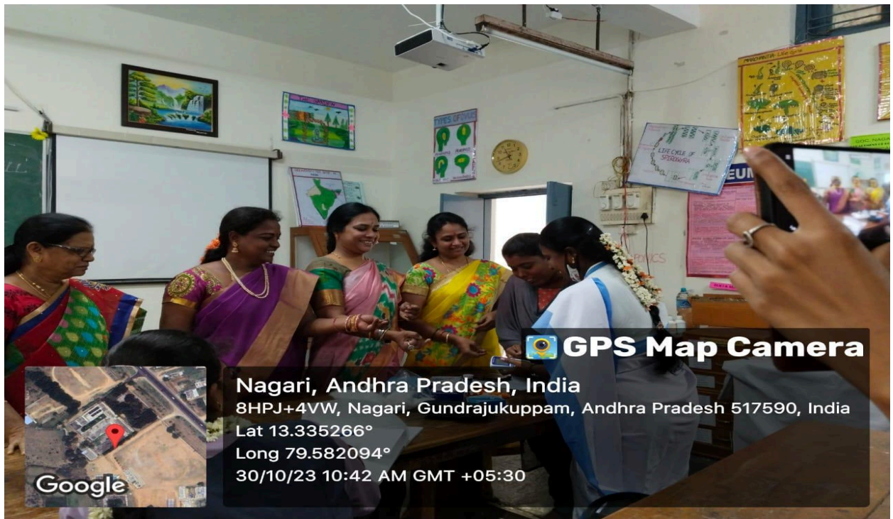
PHC staff doing Health check- ups for Students and staff